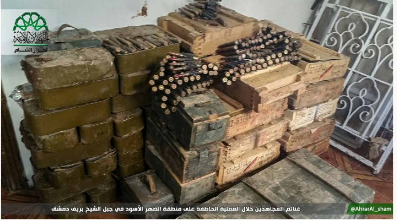
غنائم المجاهدين خلال العملية الخاطفة على منطقة الضهر الأسود في جبل الشيخ بريف دمشق