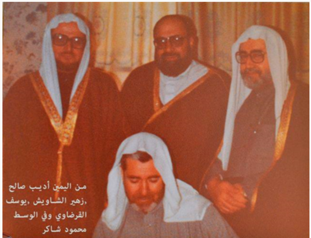
المؤرخ الجغرافي الشيخ محمود شاكر بين إخوانه الأعلام